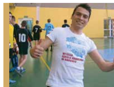
Student podczas Turnieju Piłki Nożnej