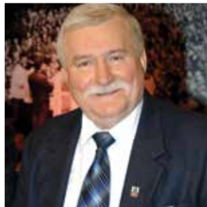
Lech Wałęsa podczas wykładu „Quo Vadis Polsko?”

Akademia Handlowa Nauk Stosowanych w Radomiu prowadzi aktywną działalność na rzecz środowiska lokalnego poprzez organizację licznych wydarzeń: