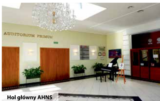
Hol główny AHNS