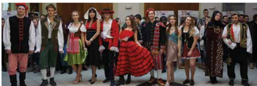
Dzień Kultury Europejskiej