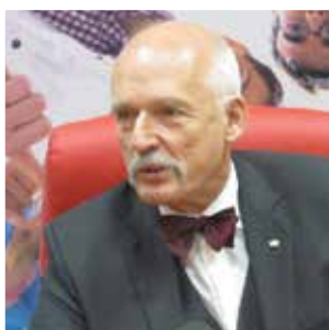
Janusz Korwin – Mikke „Współczesne nonsensy gospodarcze”