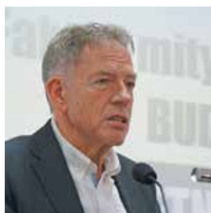
Dariusz Rosati gościł z wykładem „Czy Polsce opłaca się przyjąć walutę Wspólnoty Europejskiej?”