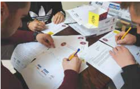
Uczniowie piszący listy w obronie praw człowieka w ramach Maratonu Pisania Listów