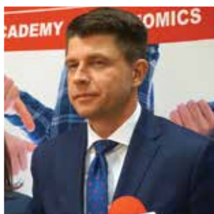
Ryszard Petru „#LepszaPolska – wyzwanie dla gospodarki”