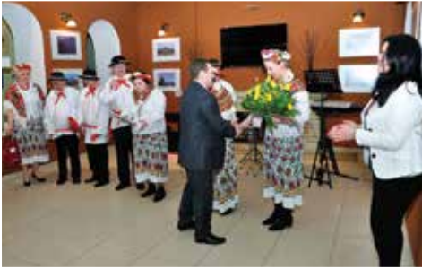
Występy zespołu podopiecznych z Domu Pomocy Społecznej w Jedlance z okazji realizacji projektu „Niepełnosprawni – pełnosprawni” w AHNS