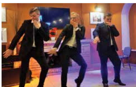
Koncert z okazji Dnia Kobiet