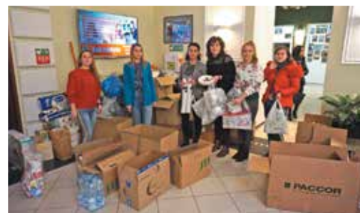
Zbiórka darów dla uchodźców z Ukrainy