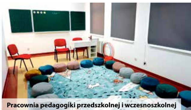
Pracownia pedagogiki przedszkolnej i wczesnoszkolnej