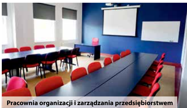
Pracownia organizacji i zarządzania przedsiębiorstwem

To siedziba Akademickiego Studium Kształcenia Praktycznego (ASKP). To jednostka organizacyjna, która pomaga studentom i słuchaczom zdobywać kompetencje poszukiwane na rynku pracy i pozwala, już na etapie studiów, zapoznać się z wyzwaniami zawodowymi, jakim będą musieli stawić czoła w trakcie swojej profesjonalnej kariery.