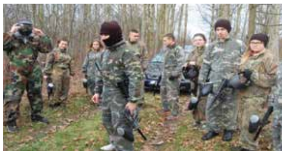
Szkolenie Legii Akademickiej AHNS