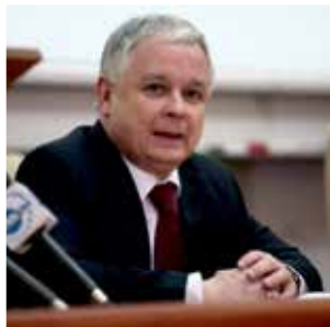
Lech Kaczyński podczas wykładu „Obywatele i państwo”