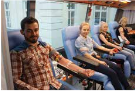
Studenci AHNS uczestniczący w akcji dobroczynnej Time of Blood