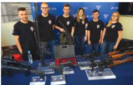
Legia Akademicka podczas Wystawy Broni