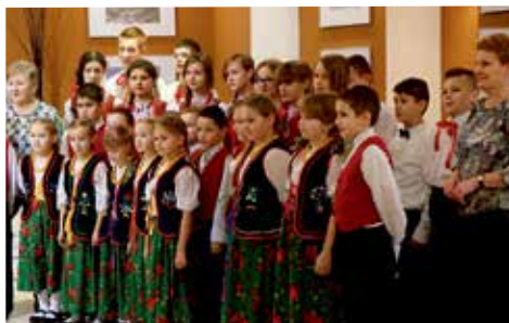
Koncert podczas realizacji projektu Niepełnosprawni - pełnosprawni