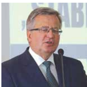
Bronisław Komorowski „Irak, Ukraina – dlaczego Polska angażuje się w wewnętrzne sprawy innych narodów?”