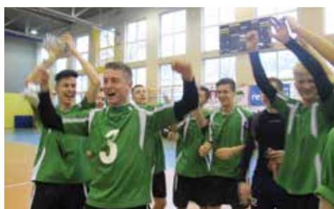
Zwycięzcy Turnieju Piłki Nożnej organizowanego przez AHNS