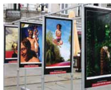
Galeria na deptaku w centrum Radomia