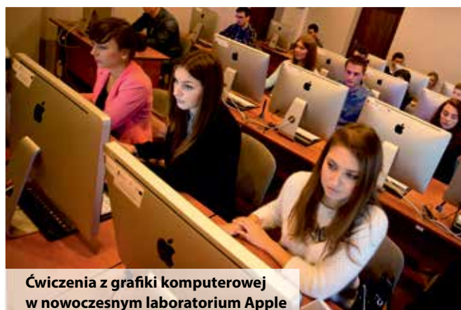
Ćwiczenia z grafiki komputerowej w nowoczesnym laboratorium Apple