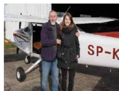
Zajęcia podczas kursu szybowcowego