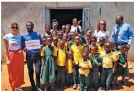
Studentka AHNS na wolontariacie w Afryce