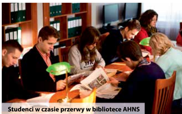
Studenci w czasie przerwy w bibliotece AHNS