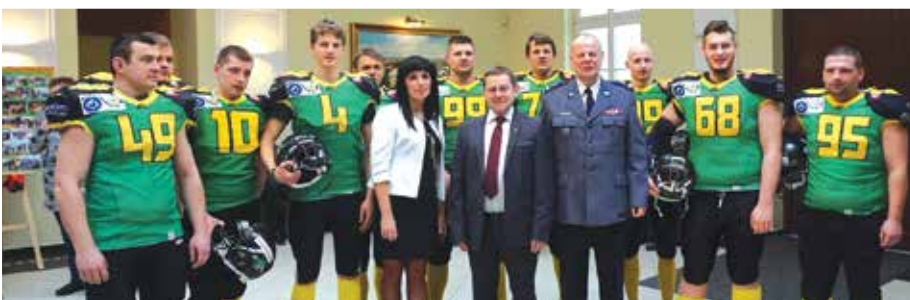
Prezentacja zespołu futbolu amerykańskiego Green Ducks w Radomiu podczas realizacji projektu „Niepełnosprawni – pełnosprawni” w AHNS