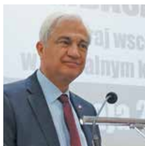
Ambasador Turcji Tunç Üğdül „Kraj wschodzący: rola Turcji w globalnym krajobrazie politycznym”