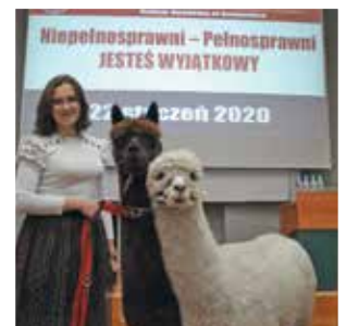
Zajęcia z alpakoterapii