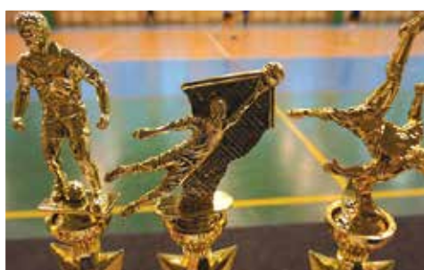
Nagrody dla zwycięzców Turnieju Piłki Nożnej organizowanego przez AHNS