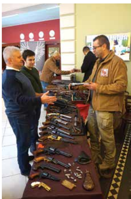
Wystawa broni w AHNS