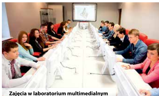
Zajęcia w laboratorium multimedialnym