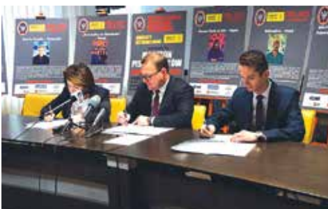
Finał akcji - Maraton Pisania Listów