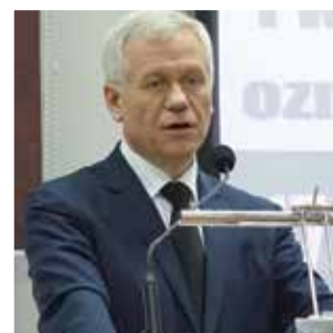
Marek Jurek „Zachód na przełomie – czy Brexit i wybór Donalda Trumpa oznaczają koniec pewnej epoki?”