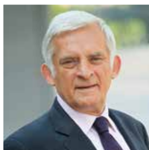
Jerzy Buzek „Polska droga do Unii Europejskiej”