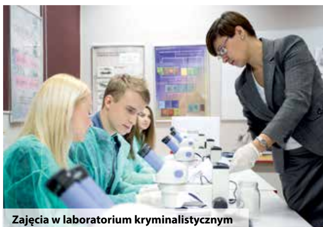
Zajęcia w laboratorium kryminalistycznym

Jest siedzibą Wydziału Studiów Strategicznych i Technicznych. Znajdują się tu Aule Główne A i B, dwie mniejsze aule mieszczące po 130 miejsc, sale dydaktyczne oraz nowoczesnie wyposażone pracownie i laboratoria komputerowe, w których studenci przygotowują się do uzyskania specjalistycznych certyfikatów.