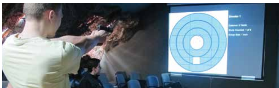
Zajęcia w strzelnicy elektronicznej w budynku AHNS