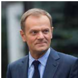
Donald Tusk gościł z wykładem „Czy potrzebna nam IV Rzeczpospolita?”