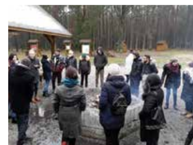
Raid Mikołajowy organizowany przez AHNS