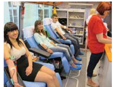
Time of Blood