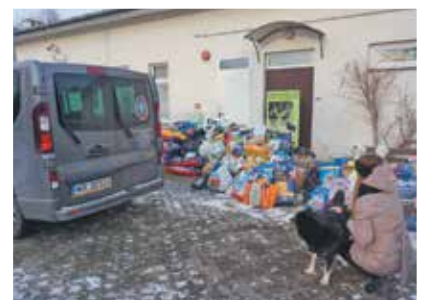
Zbiórka Prezent dla PSJciela