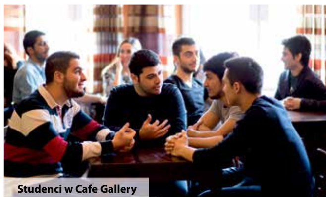
Studenci w Cafe Gallery