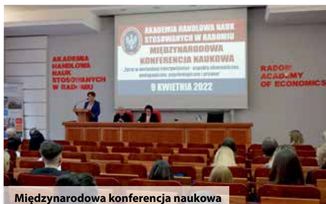
Międzynarodowa konferencja naukowa

Kampus przy ul. Traugutta 61a to siedziba Wydziału Nauk Społecznych i Wydziału Prawa i Administracji. Znajdują się tu Auditorium Primum, aule wykładowe, sale ćwiczeniowe, pracownia komputerowa, a także profesjonalne laboratorium kryminalistyczne oraz strzelnica.