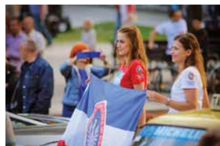
Rozpoczęcie 10. Ogólnopolskich Spotkań Filmowych „Kameralne Lato”